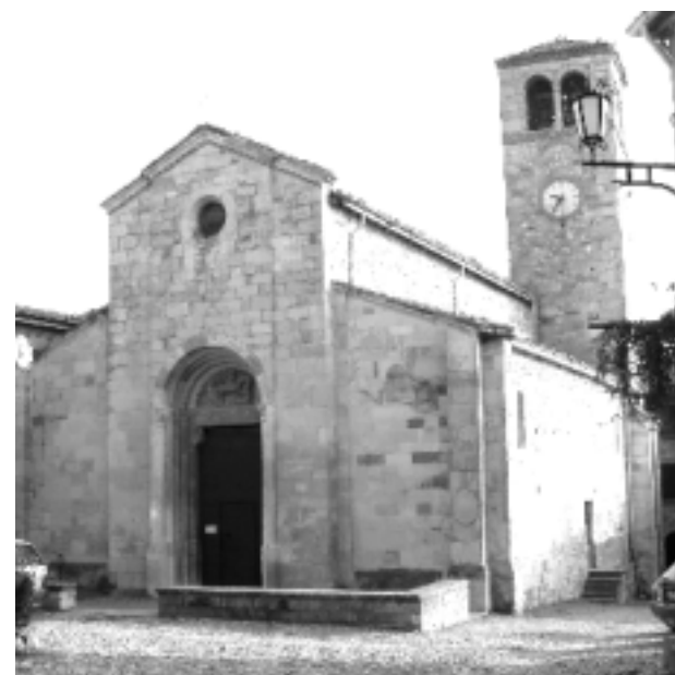
Vigoleno, Chiesa di San Giorgio